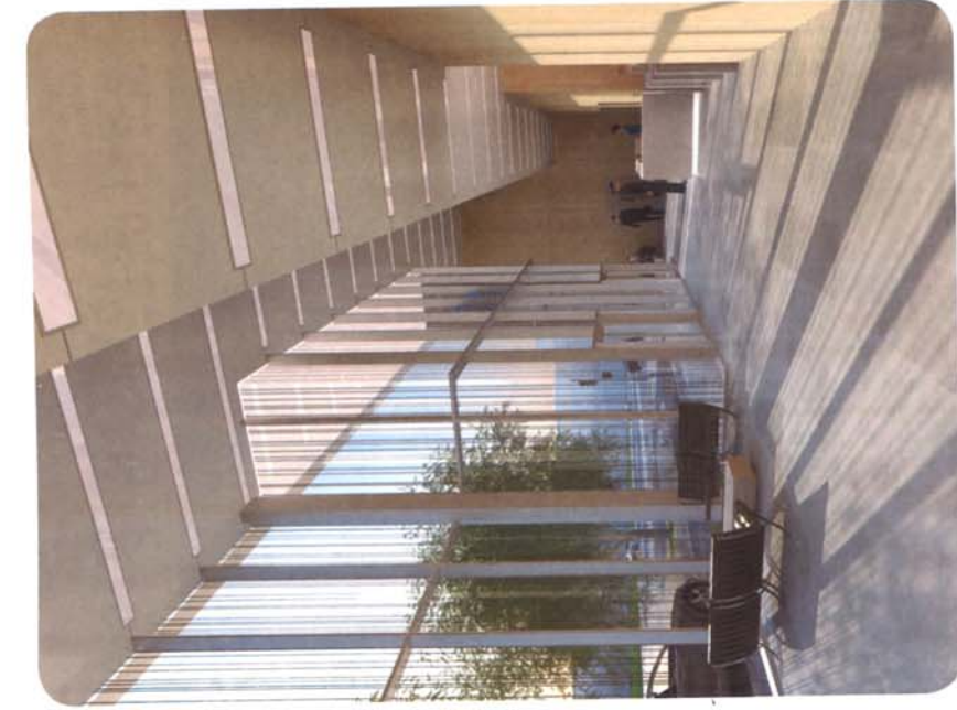
The Crown Vue Hall