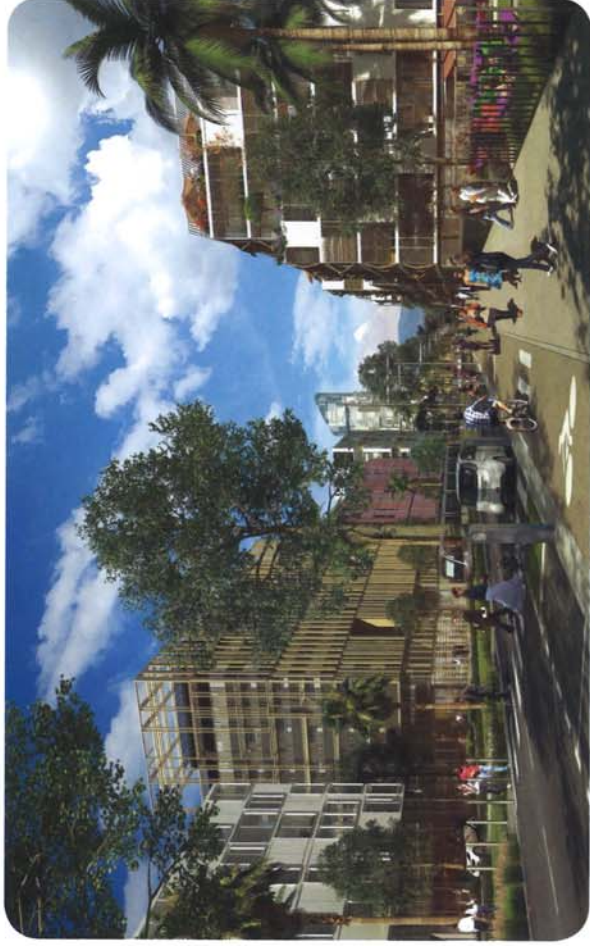
Perspective de l'avenue Simone Veil avec l'immeuble « The Crown » au premier plan à gauche.