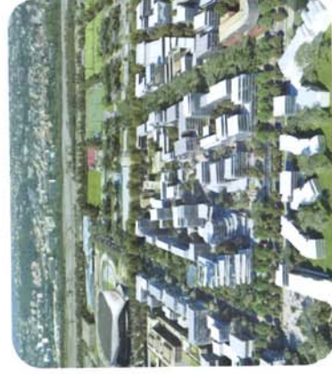
Nice Méridia, une future technopole vivante et dense.

Projet qui doit s'étaler sur une trentaine d'années, l'Eco-Vallée commence à entrer dans une phase opérationnelle et ses premiers contours se dessinent à Nice Méridia. Le lancement imminent de la construction de l'immeuble « The Crown », où s'installeront IBM et EDF, marquera véritablement le départ de la réalisation de cette technopole urbaine qui privilégiera la mixité et l'innovation.