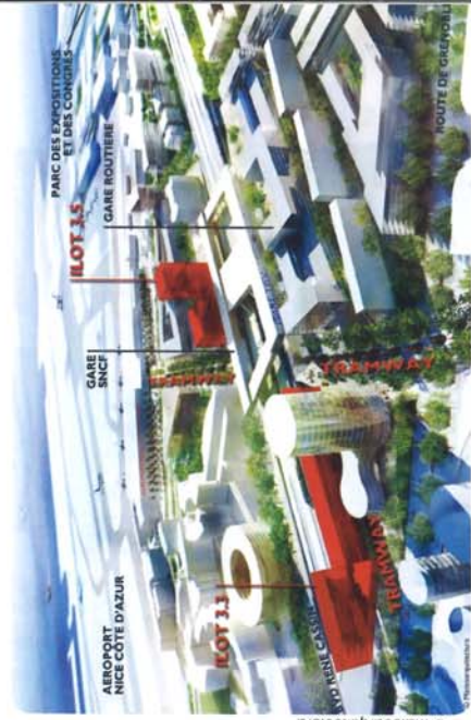
Le projet du Grand Arénas

IBM will leave La Gaude for Nice Méridia. Is this transfer a stroke of luck for the Métropolis?