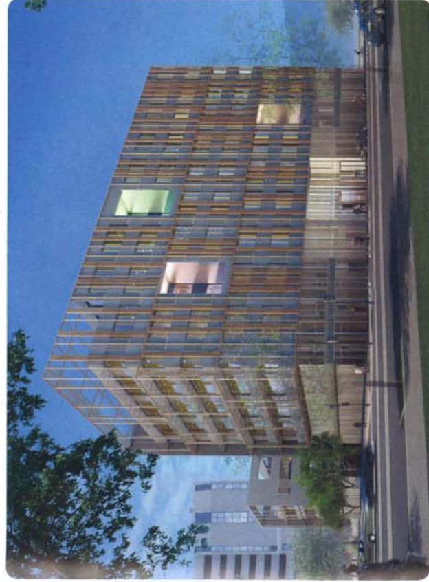
Le nouveau bâtiment « The Crown »

Le choix, pour cet ilot 3.3 de l'architecte niçois Marc Barani, lauréat du prix de l'Équerre d'Argent, est effectivement un signe fort au vu de la qualité de ses réalisations. Pour nous, il est capital que ces premiers immeubles soient particulièrement réussis, car ils vont donner le la de l'excellence architecturale, nous rappeler de nos vœux pour ce quartier, appelé à devenir, demain, le cœur de la Métropole Nice Côte d'Azur. ■