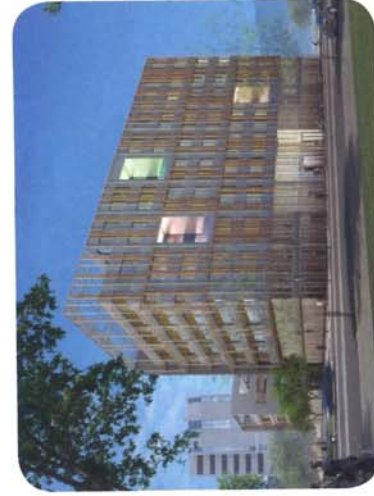
Vue extérieure de l'immeuble « The Crown » qui accueillera IBM et EDF.