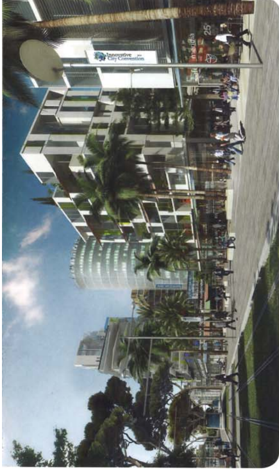
Une technopole urbaine qui prendra place entre l'avenue Simone Veil et le boulevard du Mercantour.

Outre ces opérations, l'EPA va également favoriser la restructuration d'entreprises déjà présentes sur le site. Lorsqu'elles se sont installées dans le quartier, il n'y avait rien autour et ces dernières disposaient d'un foncier très important sur lequel elles se sont étalées en prenant leurs aises. Aujourd'hui, elles vont profiter de l'aménagement de Nice Méridia pour se moderniser et se restructurer, tout en obtenant de nouvelles sources de financement. C'est ainsi que Nice-Matin va vendre une partie des terrains qui entourent son siège, une vente qui devrait permettre au quotidien régional de sortir en partie de la crise financière qu'il traverse actuellement. Plus au Nord, Renault va regrouper ses concessions de Nice et de Cagnes-sur-Mer dans un nouveau bâtiment plus dense, libérant au passage beaucoup de foncier sur lequel émergera de nouveaux immeubles de bureaux et de logements. Ainsi, avec la mise en œuvre de toutes ces opérations, une technopole urbaine va commencer à prendre forme. Le concept de Nice Méridia repose en effet sur l'idée d'une ville vivante et dense, misant sur une grande mixité, avec des logements, des bureaux, des commerces et des équipements publics desservis par le tramway - une technopole urbaine qui donnera la priorité à l'innovation et aux activités technologiques avec pour objectif de compter, à l'issue de la première phase du programme, près de 5 000 habitants et plus de 4 000 emplois. ■