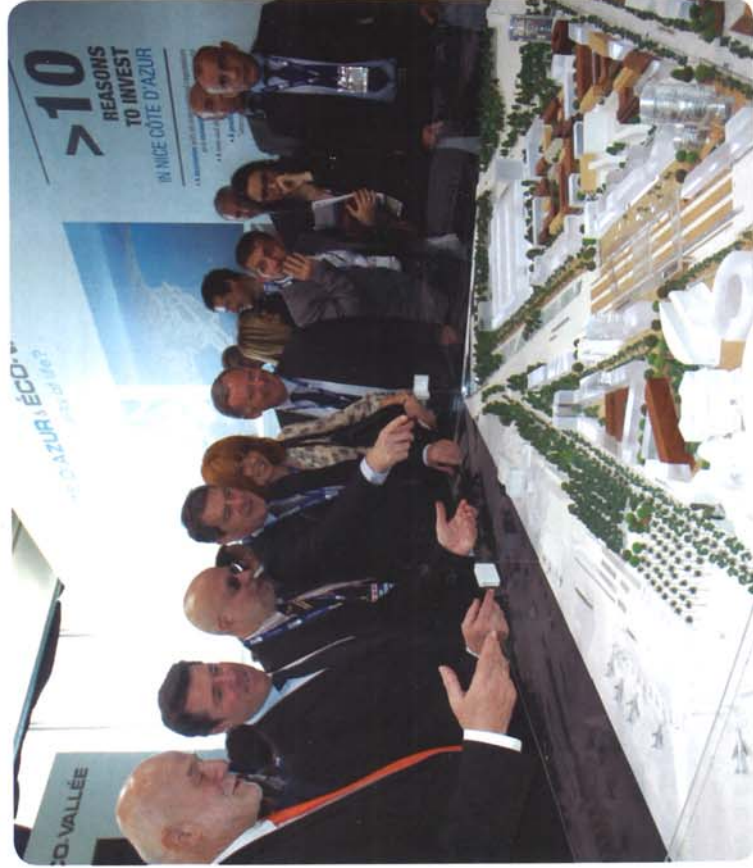
Christian Estrosi devant la maquette du projet Eco-Vallée

« L'Éco-Vallée poursuit sa marche en avant »