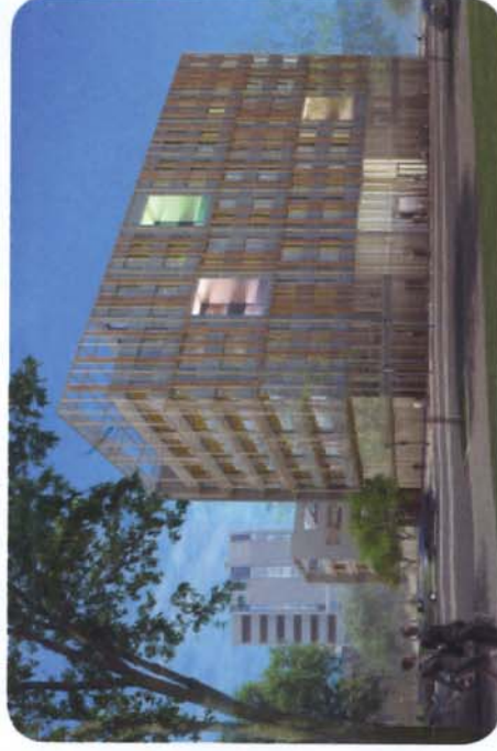
The Crown vue extérieure